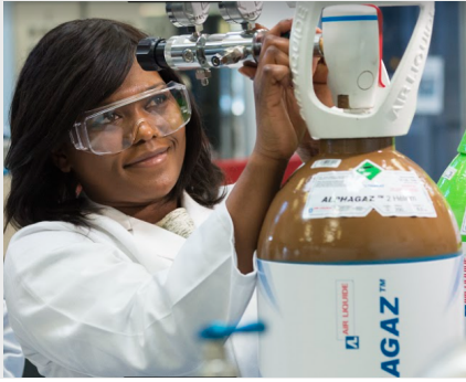
Air Liquide's Gas Encyclopedia - Pages 989 - 998

ALPHAGAZ är Air Liquides enkla och säkra produktval för laboratorieändamål ALPHAGAZ 1 är utvecklat för analys från % till ppm